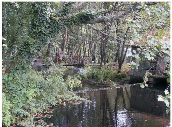
Área recreativa O Inquiáu